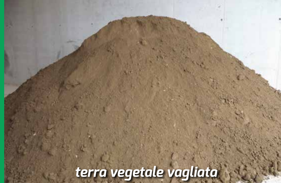
terra vegetale vagliata